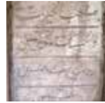
Kitabesi (Hicri 1311): Sâhibü'l-hayrât ve'l-hasenât bâni-i sâni[nin] rûhları şâd olsun

Çeşme, hazneli olup kare planlıdır. Tuğla örgülü çeşmenin ayna taşı ve kurnası mermerdir. Çeşmenin sokağa bakan cephelerinde birer adet olmak üzere iki kitabesi bulunmaktadır. Çeşmenin temizlik ve bakımı yapılmıştır.