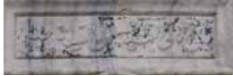
Tamir Kitabesi (Hicri 1311): Bâni-i sâni es-Seyyid Ahmed İbni es-Seyyid Ahmed Halebî

Çesme, Küçük Ayasofya Mahallesi'nde, Kadirga Meydanı Sokakı üzerinde yer almaktadır. Kanuni Sultan Süleyman tarafından yaptırılan çeşmenin tamir kitabesinden Seyyid Ahmed tarafından 1893-94 yılları arasında tamir ettirildiği anlaşılmaktadır. Sadeliğiyle Klasik Dönem mimarisini yansıtan çeşmede temizlik ve önleyici koruma çalışmaları yapılarak suyuna kavuşturulmuştur.