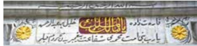
Kitabesi (Hicri 1342): Bismillahirrahman Errahim / Ey mülk'ün sahibi olan Allah! Farezade Halil bin Abdurrahman Ya Rab! Beni ve ümmet-i Muhammed'i şefaati-i Peygamberi'den mahrum kılma!

Cesmenin yüzeyi kimyasal ve mekanik yöntemlerle temizlenerek plastik onarımları yapılmıştır. Kurnasındaki eksik parçalar tamamlanmış, kitabesinde renk ve altın varak çalışması yapılarak suyuna kavuşturulmuştur.