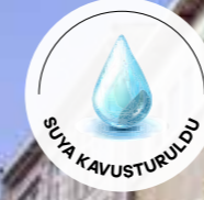
Sağ Küçük Çesme Üstü Hak yoluna bu çeşme-i pâkizeyi yapı