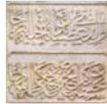
Kitabesi (Hicri 1276): Keçecizâde Hanedanı makberesidir Vâlidî atşândan târîhle eyler recâ Çeşmeden gel iç su rûh-ı Kâzîma eyle du'â

Barok karakterli çesme, bitki motifleri ile süslü iki sütun arasında oymalı büyük bir ayna taşından oluşmuştur. Teknesi beyzî bir kurna biçimindedir. Çesme yüzeyindeki kirlilikler temizlenmiş, sütunları üzerine eklenen beton kemer kaldırılarak altın varakları yapılmıştır. Tesisatı yenilenen çesme yeniden suyuna kavuşturulmuştur.