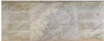
Kitabesi (Hicri 1279):

Çesmenin arka cephesindeki yıkılan duvar özgün malzeme ve geleneksel teknikle tamamlanmıştır. Kitabe üzerinde bulunan taç bölümü tasındığı İSKİ Vakıf Sular İdaresi'nden alınarak yerine monte edilmiştir. Cephe üzerinde bulunan çimento esaslı niteliksiz sıvalar kaldırılmış, özgün hidrolik kirec harçlı siva ile sıvanmıştır. Çesmenin mermer ayna taşı temizliği yapılmış, seki ve kurna taşları konularak yeniden suyuna kavuşturulmuştur.