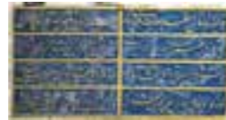
Kitabesi (Hicri 1112):

Onarım kapsamında çimento esaslı nitelsiz müdahalelerin itinalı raspa çalışmaları yapılarak, özgün hidrolik kirec esaslı derz onarımları tamamlanmıştır. Çesmenin temizlik ve bakım çalışmaları yapılmıştır.