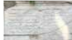
Kitabesi (Hicri 1145):

Kare planlı ve hazneli cesmenin sağ yan cephe duvarının bir bölümü üzerindeki otsu ve odunsu bitkilerin verdiği tahribat sonucunda yıkılmıştır. Cesmenin özgün döşeme seviyesinin günümüzde yol kötü altında kalması ve sokağın darlığı sebebiyle kot çalışması yapılamadığından dolayı cesme aktif hale getirilememistir. Cesmede cimento esaslı niteliksiz müdahaleler alınarak derz temizliği yapılmış; cephedeki almasıık duvarların eksik tas ve tuğlaları tümlenerek özgün harc ile derzlenmiştir. Günümüze ulaşmayan çatısı yapılarak kiremit örtüyle kaplanmıştır.