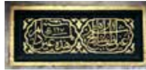
Kitabesi (Hicri 967): Ayn-ı lütf-i şâh-ı erşed târîh Hâzihî aynün li-mâin dâim

Sade görünlü ve sivri kemerli olan çeşmenin üzerinde bulunan cemento esaslı niteliksiz onarımları kaldırılmıştır. Gerekli yerlerde tımlmeler ve kaybolan parçaların plastik onarımları yapılmıştır. Çeşmenin yol kotu altında kalan kurna ve oturma sekileri açığa çıkartılarak çevre düzenlemesi yapılmıştır. Kitabesi varaklanan çeşme yeniden suyuna kavuşturulmuştur.